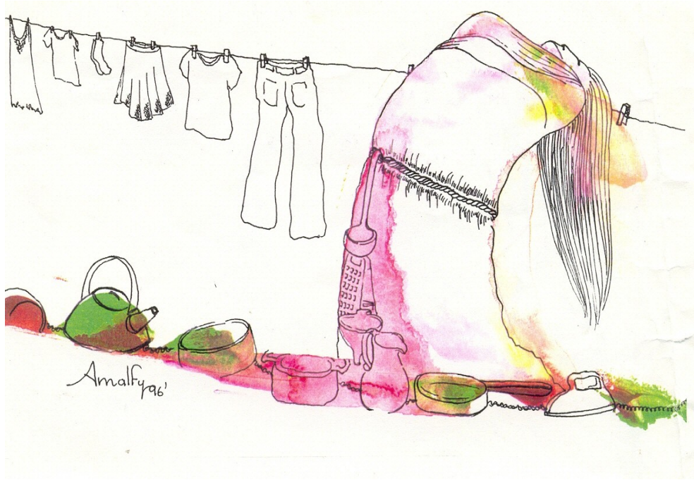
Imagen: Fuenmayor Noriega; Amalfy (2004). Atrapadas en el laberinto cotidiano . Venezuela.

Queda claro entonces, como afirma María-Milagros Rivera que: