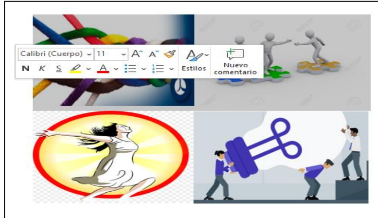
Ilustración 7: Necesidad de liberación