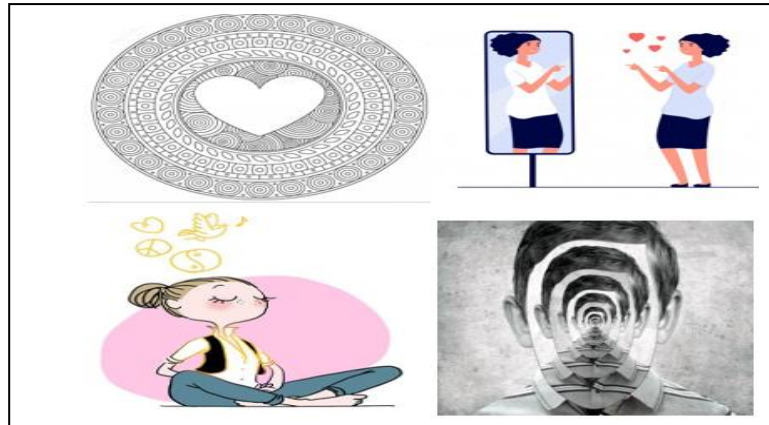
Ilustración 3: Necesidades de identidad emocional

Sin centro, experiencia inferior o superior o externa del cuerpo. Imagen corporal, los bloqueos emocionales desplazan el centro a la periferia.