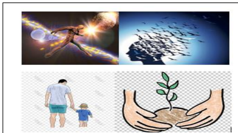
Ilustración 6: Necesidad de trascendencia

Esta necesidad surge en el humano cuando las necesidades anteriores se han satisfecho. "Escribe un libro, siembra un árbol, ten un hijo." Trasciende.