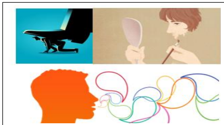
Ilustración 4: Necesidades de identidad verbal

Complementa el esquema corporal emocional, permite la relación con la comunicación lingüística, descripciones adecuadas de inadecuadas (programas). Un programa negativo: Creer ser menos y hacer tu vida miserable, o creer ser más y hacérsela a otros miserable. Estructuras de creencias dificultan el fluir