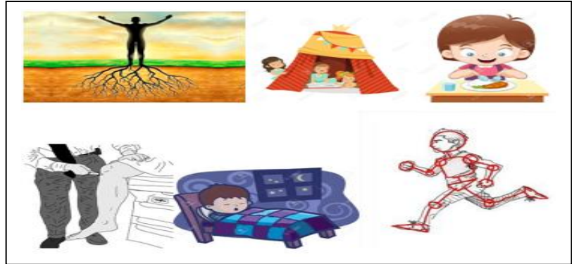
Ilustración 1: Necesidades de sobrevivencia

En estas necesidades están los instintos y los reflejos, se incluyen también: dormir, soñar, comer, arraigo, seguridad, tocar y libertad de movimiento.