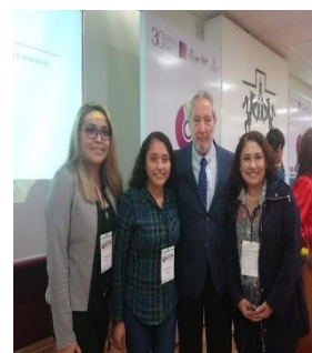
Imagen 1. Foro COMIE

Como prácticas de campo se participó en el Foro de Investigación Educativa organizado por el Consejo Mexicano de Investigación Educativa, sede Universidad Iberoamericana, Puebla realizado el 17 de mayo de 2019 (Ver imagen 1). En este Foro se participó en dos mesas de trabajo: decisiones metodológicas para la elección del objeto de estudio y la construcción de la aproximación teórica.