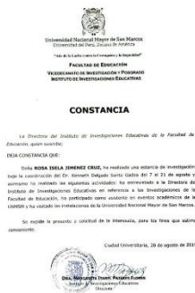
Imagen 7. Constancia estancia de investigación.