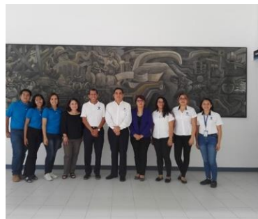
Imagen 8. Actividades de investigación