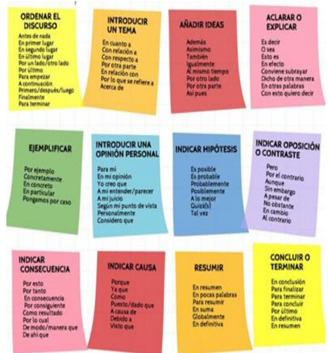
Ilustración 2. Tipos de conectores

Entre ellos pueden existir distintos tipos de relación: oposición, causa-consecuencia, etc.